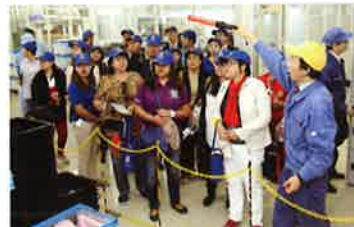
The Philippines team observing the parts production. 組立部門を見るフィリピンチーム

のメイドインジャパンを体感していました。先には香港チームやマレーシアチームが訪れるなど、海外からの大阪工場見学が相次いでいます。