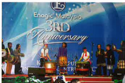
A grand percussion performance opened up the event. オープニングを飾った勇壮な打楽器演奏