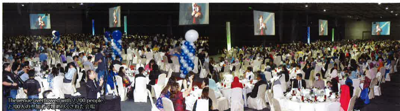
The venue overflowed with 2,200 people. 2,200人の参加者で埋め尽くされた会場