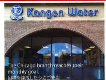
The Chicago branch reaches their monthly goal. 目標を達成したシカゴ支店

マレーシア、インドネシア、シンガポール、フィリピン、オーストラリア、ハワイ、シカゴ、フロリダ、ニューヨーク、バンクーバー、ブラジル、フランス、イタリア