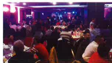
Hundreds of people gathered at the venue. 数百人が詰めかけた会場

ジネスを牽引し6A2-3に到達したポパさんのたゆまない努力を称え、さらに研修センターをフル活用して、いっそうの発展を遂げるよう熱い期待感を表明しました。数百人の参加者は、はるばる日本からやって来た大城会長夫妻を大歓迎し、セレモニーはたいへんな盛り上がりを見せました。