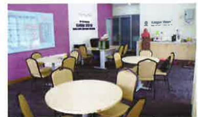
A lounge and reception counter (in the back) サロンと受付カウンター(奥)