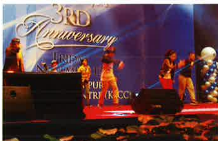
Lively dance performance by the children. 軽快なステップで踊る子どもたち