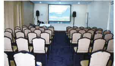
A seminar room with the capacity of 170 people. 最大170人収容可能なセミナールーム