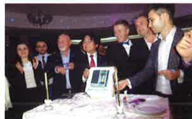
Leveluk shaped cake-cutting-ceremony with the leading distributors. 有力販売店とともにレベラックをかたどったケーキに入刀