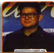
Won Sylll Honn