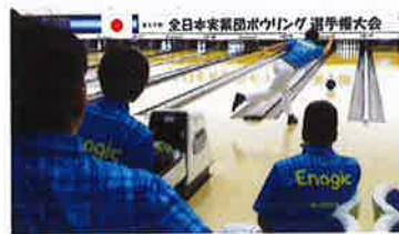
The team scored an average of 218.933 pins. アベレージ218.933を叩き出したチーム