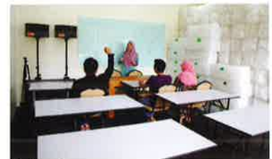
2nd seminar room. 第2セミナールーム