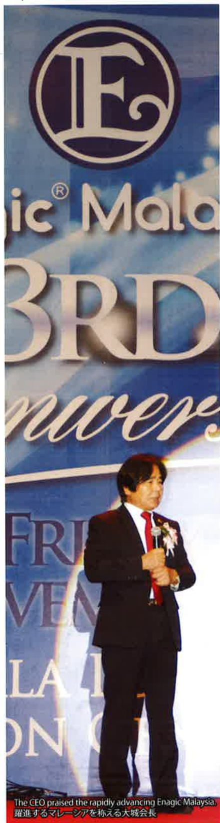
The CEO praised the rapidly advancing Enagic Malaysia. 躍進するマレーシアを称える大城会長

On the evening of November 13, the convention center in Malaysia's capital, Kuala Lumpur, was brimming with 2,200 people, who gathered to join the celebration for Enagic Malaysia's 3rd anniversary.