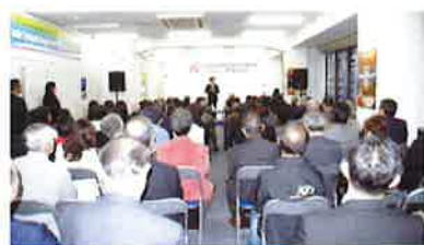
A fully packed venue. 超満員になった会場