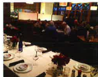
The restaurant is always bustling with a diversity of customers. 店内は多種多様な人たちでいつも賑わっている