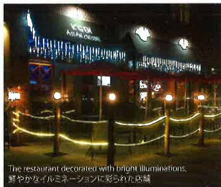
The restaurant decorated with bright illuminations. 鮮やかなイルミネーションに彩られた店舗

さらにアジアの多種多様なハーブが還元水とマッチして素材のうまみを引き出し、地元の人たちだけでなく遠方から来る人たちの胃袋も満足させているのである。