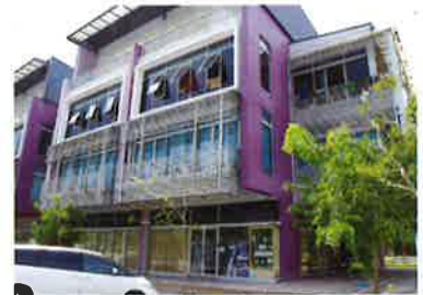
The office is located on the 1st floor of a new building. 新築ビル1階に入居するオフィス

夫妻のモットーは、フェアな精神で正しい情報を伝えて仲間を大切に育成していく、というもの。新興国マレーシアにエナジックビジネスの新しい風が吹きはじめ