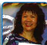
Wong Fung Neon