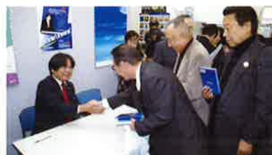
The long line at the signing desk. 行列ができたサイン会