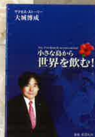
小さな島から世界を飲む

「小さな島から世界を飲む」エナジックの各支店または http://www.enagic.com で購入可