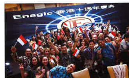
The vibrant Indonesia team. 元気いっぱいのインドネシアチーム