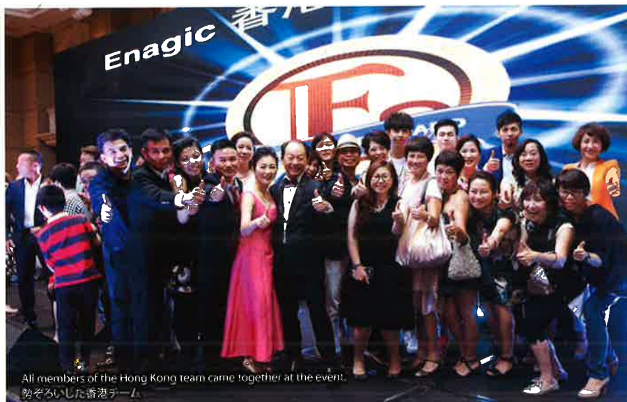
All members of the Hong Kong team came together at the event. 勢ぞろいした香港チーム

On October 10, Enagic Hong Kong's 10 year anniversary celebration was held in Shenzhen, Guangdong, which is situated next to Hong Kong and is one of the most successful Special Economic Zones. Over 1,000 distributors gathered at the hotel venue, many of which were from Hong Kong and China while others traveled from Japan and Southeast Asia.