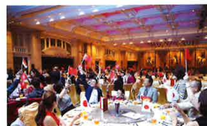
The largest group of the China team waving their flag. 国旗を振るう最大多数の中国チーム