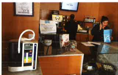
Leveluk installed inside the cafeteria. 店内に置かれたレベラック