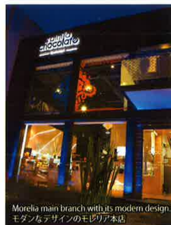
Morelia main branch with its modern design. モダンなデザインのモレリア本店

Phone: +52 443 3146905 www.vainillachocolate.mx