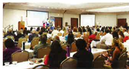
The venue was filled with participants. 会場のホテルは超満員に

トップリーダーたちによるトレーニングも白熱し参加者は熱心に学んでいました。また、2日目のディナーパーティのさいには、ハワイらしく、ウクレレ演奏に乗ったフラダンスで場を盛り上げてから各種ボーナスの授与式がおこなわれ、受賞者はたいへん喜んでいました。