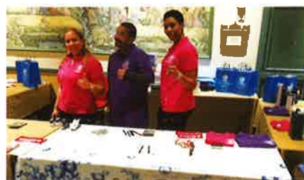
Related goods were also popular at the event. 関連グッズも人気の的