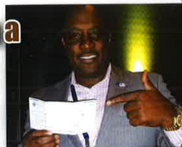
Proud smile with his title incentive cheque in hand. タイトルインセンティブの小切手を手にニコリ