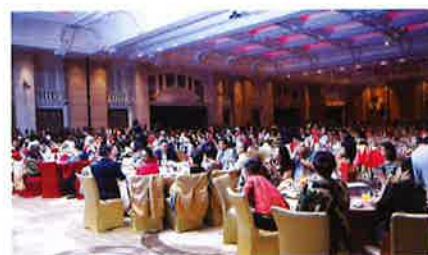
The venue overflowed with over 1,000 people. 1,000人以上が会場を埋め尽くす

さらにこの4月、香港初の6A2-5に到達したケネス・ウォンさんが中国本土出身の6A2-4販売店で妻のリアオ・チュン・ジュエンさんと共に舞台上で記念のトロフィーを受け取ると、満場の喝采を浴びていました。その後、10月までに6A(以上)に昇格した30人余の販売店の認定証授与式に移ると、会場の熱気は最高潮に達し、販売店一同はゆるぎない団結精神を発揮していました。改革開放の先陣を切った深圳市から、エナジック・ビジネスは中国本土に急速に浸透しつつあります。