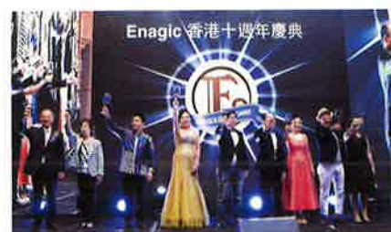
Asia's top leaders proposing the toast. 乾杯の音頭を取るアジアのトップリーダーたち