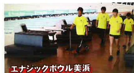
エナジックボウル美浜

(all photos are shots from the TV/いずれもテレビ画面から)