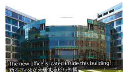
The new office is located inside this building. 新オフィスが火居するビル外観 LLC "Enagic Russia" Letnikovskaya Str. 10 bldg. 4, floor 1, 115114, Moscow, Russia Phone: +7 (495) 988-02-05; Fax: +7 (495) 988-02-06