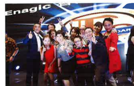
Team Japan also joined in on the celebration. 日本チームも10周年を祝う