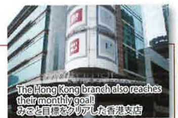
The Hong Kong branch also reaches their monthly goal! みごと目標をクリアした香港支店

Hawaii/ハワイ, New York/ニューヨーク, Vancouver/バンクーバー, Brazil/ブラジル, Hong Kong/香港, Indonesia/インドネシア, Philippines/フィリピン and Okinawa/沖縄