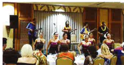
The ukulele and hula performance livened up the ceremony. 授賞式を盛り上げたウクレレ演奏とハワイアンフラ