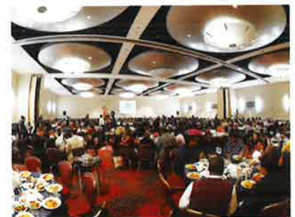
400 people celebrate the new branch office 400人が新支店開設を祝う

4階にあるオフィスを同じビルの1階に移しスペースも2倍以上に拡大します。実際の移転オープンは来年1月の予定ですが、より広くより使いやすくなった新オフィスへの期待感が高まっています。