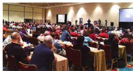
400 "students" attended the "university." 400人が「大学」で学んだ

このイベントは「Kangen大学」と名付けられ、上記トップ販売店の皆さんが「受講生」のニーズに合わせたセミナーやトレーニングをおこないました。2日間の「講義」を通じて、確かなコミュニケーションの方法や商材とプログラムの正しい知識を得るなど、多くの販売店にとって貴重な学びの場となったようです。