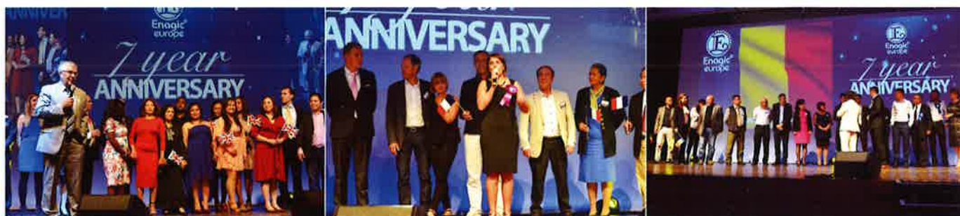
(From left) Distributors from England, France, Romania, were introduced on stage. 壇上で紹介される(左から)イギリス、フランス、ルーマニアの販売店