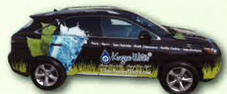
A daring Kangen Car design. 斬新なデザインのKangen車(カー)