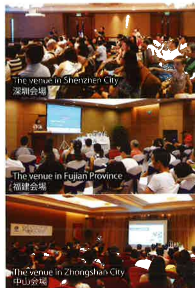
The venue in Shenzhen City 深圳会場

経済成長にやや陰りの見える中国です が、なんといっても13億人が住む超大国で す。グローバル化を進めるうえで欠かせない この国で、エナジックビジネスへの関心が高 まり、「情けの和」が広まってきています。