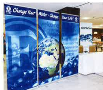
The impressive banner near the reception area 受付付近に設えた印象的なバナー