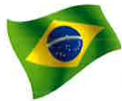
Tomiyo Ishiyama トミヨ・イシヤマ