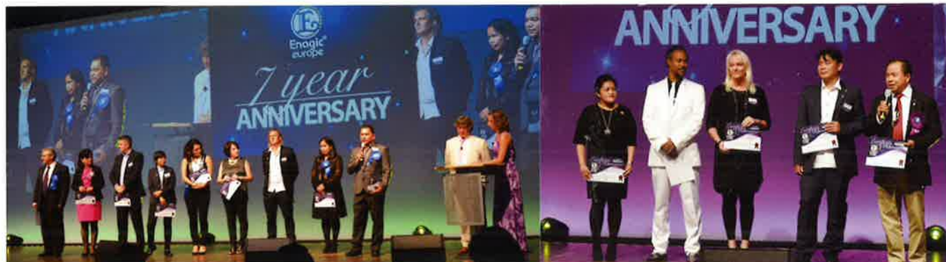
New 6A (left) and 6A2 distributors received their certificates. 認定証を授与された新6A(左)と新6A2の販売店