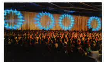
The venue overflowed with 2,000 participants. 2,000人で埋め尽くされた会場