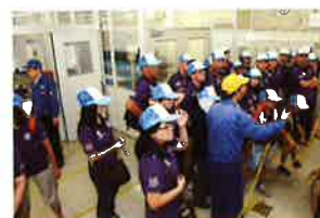
Everyone attentively observes the assembly of parts. 組み立て部門を熱心に見学