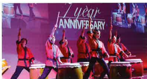
A powerful performance was given by the local Japanese drum team. 場内に響き渡った現地和太鼓チームの力強い演奏