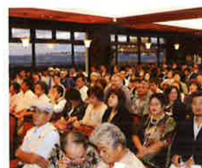
Around 200 people rushed to the launch party. 約200名が詰めかけた出版記念会